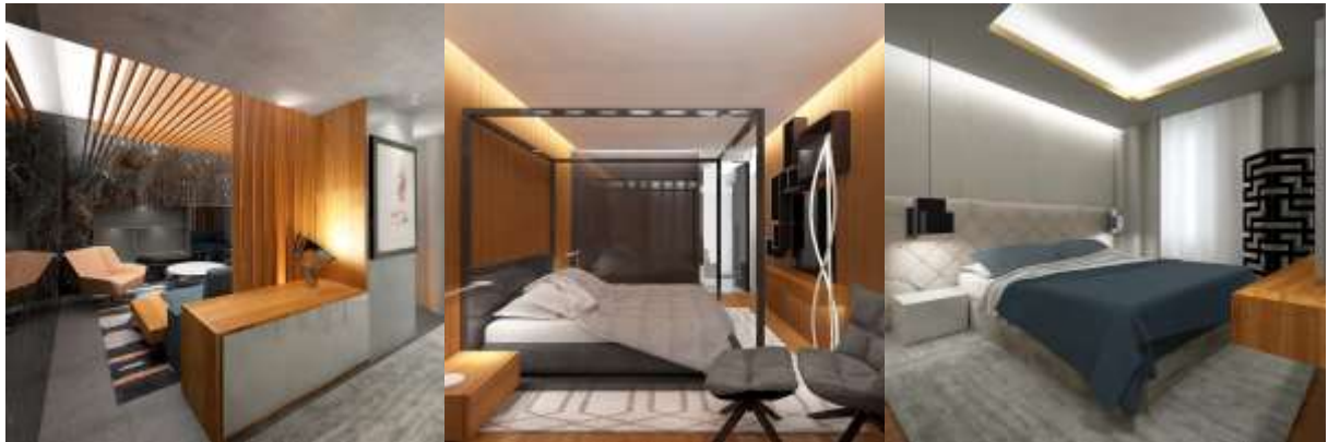
Estudo Prévio para remodelação do Palácio Do Governo Provincial do Huambo, em Angola- Cliente: Governo Provincial Huambo Previous Study for refurbishment of the Provincial Government Palace of Huambo, Angola- Client: Huambo Provincial Government