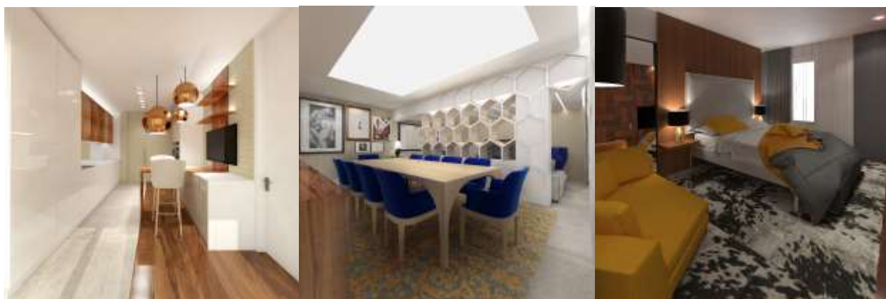
Estudo Preliminar, Estudo Prévio, Projecto de Licenciamento e Projecto de Execução de Recuperação de Apartamento na Maianga, Luanda, Angola-Cliente: Particular (em construção) Preliminary Study, Previous Study, Licensing Project and Apartment Recovery Execution Project in Maianga, Luanda, Angola-Client: Private (under construction)