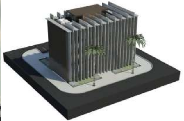
Estudo Preliminar de duas propostas para Museu de Etnografia, Cultura e História Natural, Angola- Cliente: Exergia Angola Preliminary Study of two proposals for Museum of Ethnography, Culture and Natural History, Angola- Client: Exergia Angola